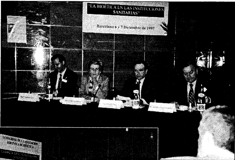
Acto de inauguración del Congreso de AEBI