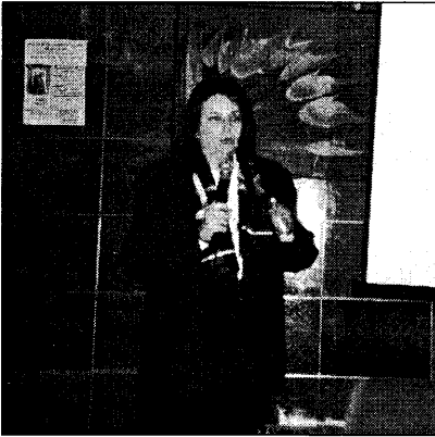
Dos aspectos de la exposición de comunicaciones. Se presentaron 52 comunicaciones en el Congreso.