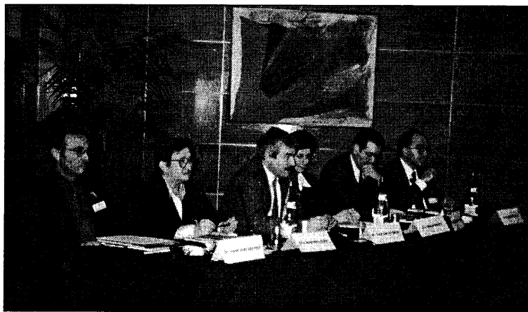
Mesa redonda: El papel de los Comités Asistenciales de Ética.