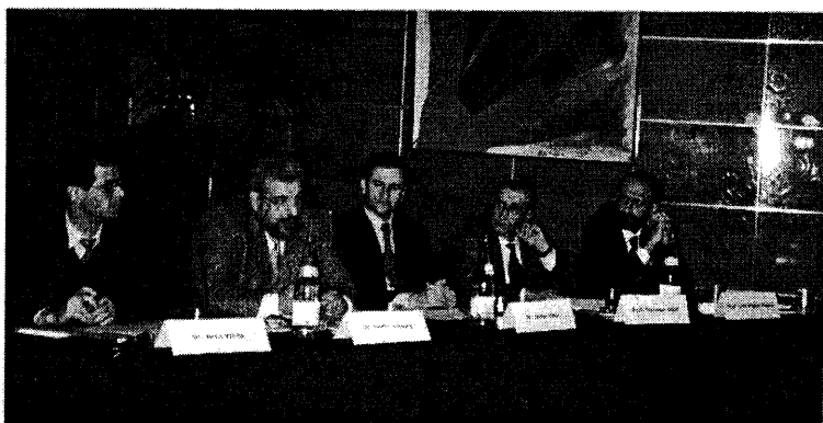
Mesa redonda: La docencia de la Bioética.