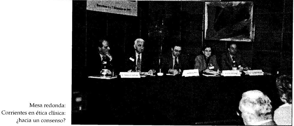
Mesa redonda: Corrientes en ética clínica: ¿hacia un consenso?